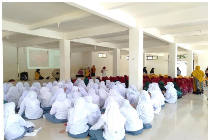
Gambar 3. Proses Diskusi pada Tahap Studi Kasus

Untuk tahap ini peserta diberikan waktu untuk berdiskusi tentang permasalahan yang dihadapi terkait seksualitas dan gender, dan mungkin ada kasus lain yang pernah dialami oleh peserta. Pertama peserta mengidentifikasi masalah, penyebabnya dan kemudian mencari solusi dari permasalahan atau kasus itu. Peserta dibagi menjadi 3 kelompok besar dimana masing-masing dari kelompok mengutarakan permasalahan atau kasus yang akan didiskusikan yaitu tentang seksualitas dan gender. Kemudian dianalisis dari masing-masing kasus tersebut dan kemudian dicari solusi bersama dengan dirembug dengan para dosen yang sudah berpengalaman.