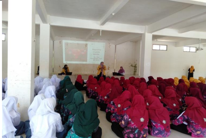
Gambar 2. Pemberian Edukasi Kesehatan Mengenai Konsep Gender dan Seksualitas